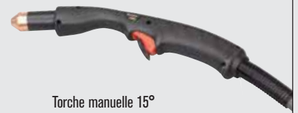
Torche manuelle 15°