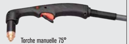
Torche manuelle 75°

Styles de torche standard Duramax (pour plus d'options de torche, consulter www.hypertherm.com )