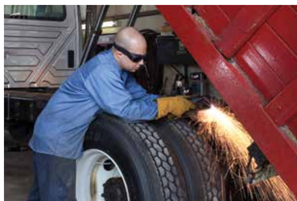
Réparation et modification de véhicules