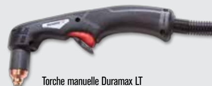
Torche manuelle Duramax LT